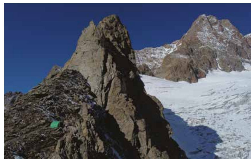
Bivacco Hess.