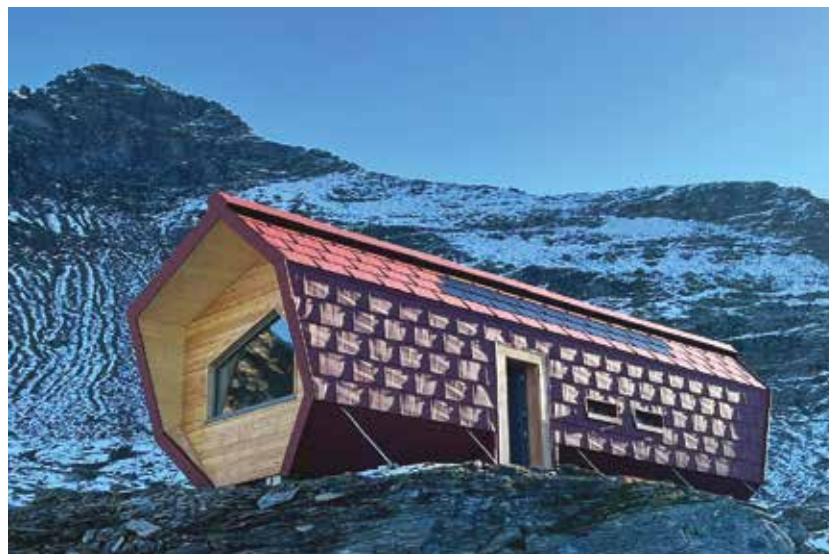
In alto: Bivacco Giacomelli. (© Alpstudio) In basso: Bivacco Piano della Parete. (© Binda / Truatsch)