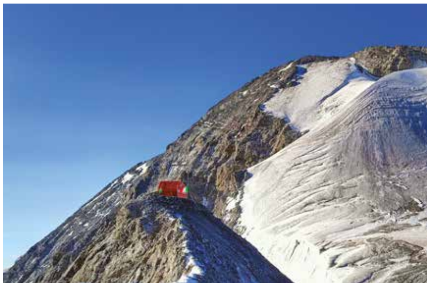
In alto: Bivacco Annibale. In basso: Bivacco Città di Cantù.