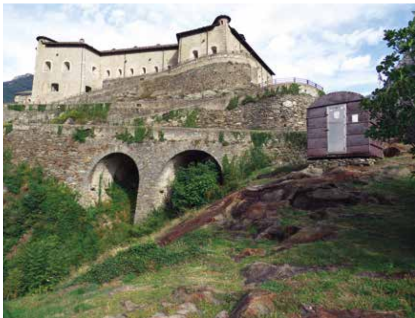
Bivacco Sberna, ricollocato al Forte di Bard.

lo, messo a punto dai fratelli Ravelli, il bivacco è l'esito di un processo di produzione seriale (o potenzialmente tale), svolto fuori opera, lontano dal sito di collocazione, dove, in genere, sono invece sufficienti semplici operazioni di montaggio a secco, di ancoraggio e di allestimento interno. Una concezione frutto di una standardizzazione che garantisce la ripetibilità all'infinito della produzione, per collocazioni universali e altrettanto agevoli smontaggi, secondo un principio di reversibilità, oggi vincente in termini d'impronta ambientale e possibilità di conversioni ecologiche. Se la reversibilità rimanda all'idea di effimero, di estemporaneo, propria degli accampamenti d'antan, la versatilità ci parla di un prodotto concepito ad hoc per uno specifico ambiente