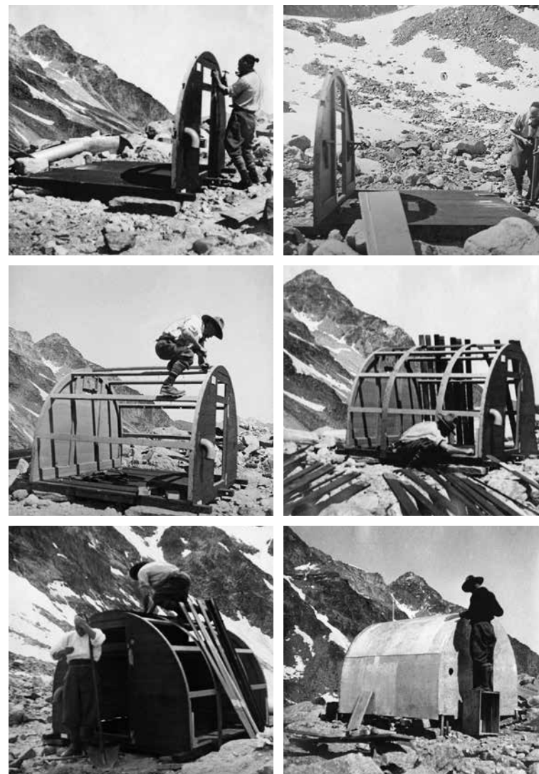
Bivacco Antoldi, sequenza di montaggio.