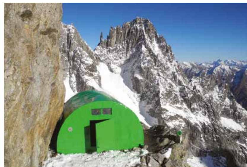
Bivacco della Brenva.