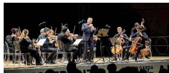
Sul palco. L'Orchestra Rai (nella foto: i cameristi) suonerà a Desenzano

Fino al 25 luglio la rassegna musicale sotto la direzione di Luca Ranieri